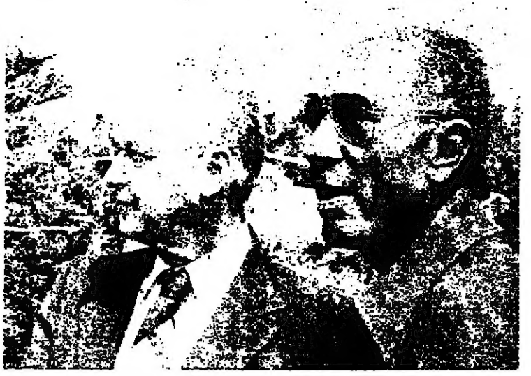
الاسكندرية - استقبل امس الرئيس انور السادات في مقره الصيفي في المعصرة رئيس الوزراء الاسرائيلي...